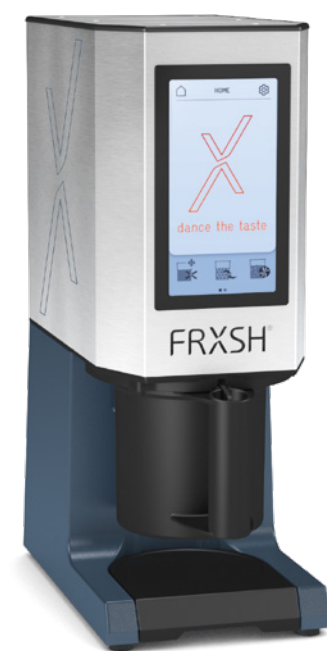
FRXSH Mousse Chef mit Schutzbecher