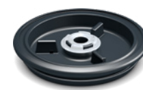
Spritzschutz und Abstreifring