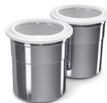
2 Chromstahl-Cups mit Verschlusskappe