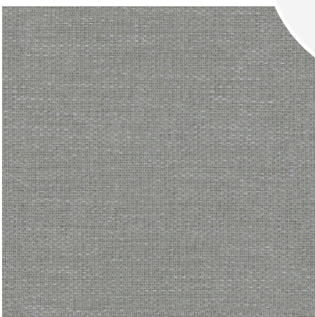
Cotton / Katoen

Ftalaat- en loodvrij en conform RoHS richtlijn, behoudt de nieuwe biobased SUNSET GREEN EDITION alle eigenschappen van een klassiek textieleen: duurzaamheid, onderhoudsgemak en een lange levensduur.