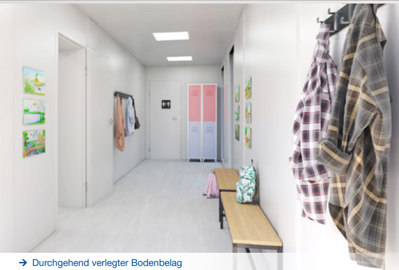
→ Durchgehend verlegter Bodenbelag