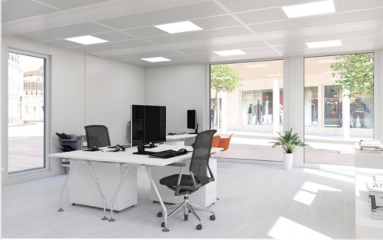
→ Helle Räume dank Vollverglasung