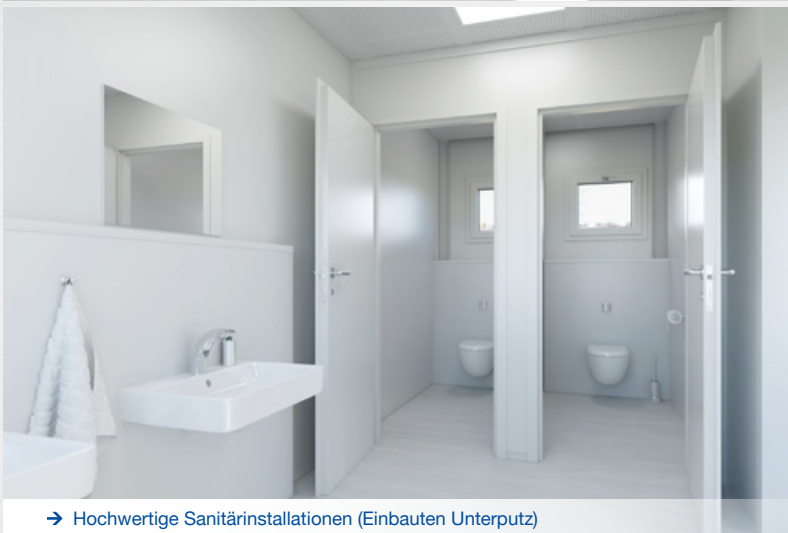
→ Hochwertige Sanitärinstallationen (Einbauten Unterputz)