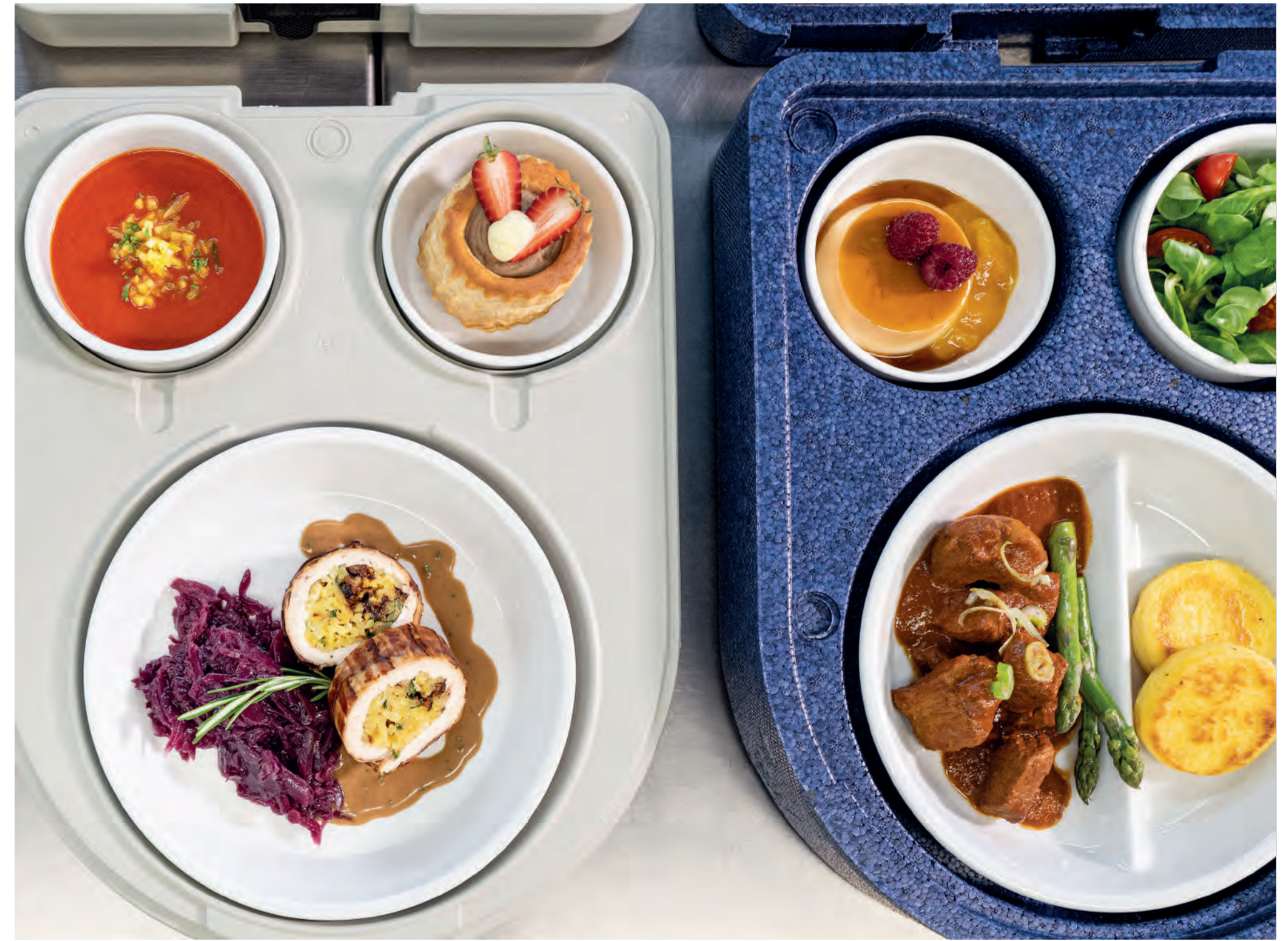
links: Hühnerbrust-roulade im Speckmantel mit 11er Rösti-Kartoffeln-Spinat-Dörflpläumen-Füllung auf Rahm-Jus und Rotkraut, dazu eine Tomatensuppe mit 11er Gemüse Brunoise und 11er Blätterteig als Pastetchen gefüllt mit Maroni-Creme (11er Maronipüree) | rechts: Gebratene 11er Polentini mit Kalbsrahmgulasch und grünem Spargel, dazu ein gemischter Salat und karamalisierte Panna Cotta mit Orangen-Reduktion. ■ left: Chicken breast roulade wrapped in bacon with a 11er Rosti-Potato-spinach-prune filling on cream juice and red cabbage, served with a tomato soup with 11er Brunoise Vegetable and 11er Puff Pastry Rolls as patties stuffed with chestnut cream (11er Chestnuts Purée) | right: Fried 11er Polentini with veal goulash with cream and green asparagus, served with a mixed salad and caramelised panna cotta with orange reduction.