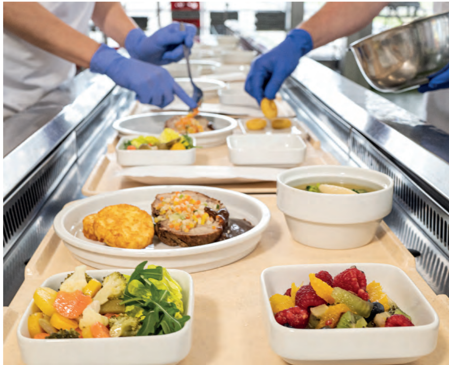
11er Röstinchen, stark vorgebacken mit Kalbsroulade in Bratensauce und 11er Gemüse Brunoise dazu 11er Euro-Mix Salat und klare Suppe mit 11er Broccoli röschen und 11er Schupfnudeln als Einlage. ■ 11er Special Small Rosti, baked extra long with veal roulade in gravy and 11er Vegetables Brunoise served with 11er Euro-Mix salad and a clear soup containing 11er Broccoli florets and 11er Potato Noodles.