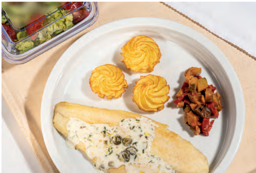
11er Pommes Duchesse, stark vorgebacken mit Pangasius in Kapern-Zitronensauce und mediterranem Gemüse. ■ 11er Special Pommes Duchesse, baked extra long with pangasius in a capers-lemon sauce and Mediterranean vegetables.