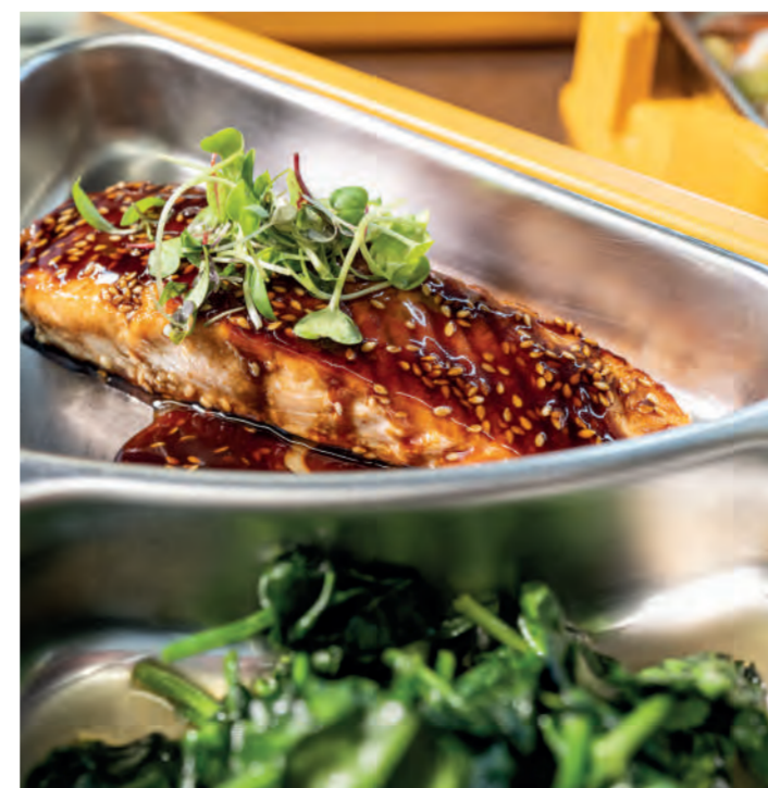
Oben: 11er Mini Röstlinchen in frischem Koriander dazu Teriyaki-Lachs mit Sesam und Blattspinat | links unten: Asiatische Gemüsesuppe (11er Wokgemüse) mit Hühnchen und Reisnudeln. ■ Top: 11er Mini Rosti in fresh coriander served with teriyaki salmon with sesame seeds and leaf spinach | bottom left: Asian vegetable soup (11er Wok vegetables) with chicken and rice noodles.