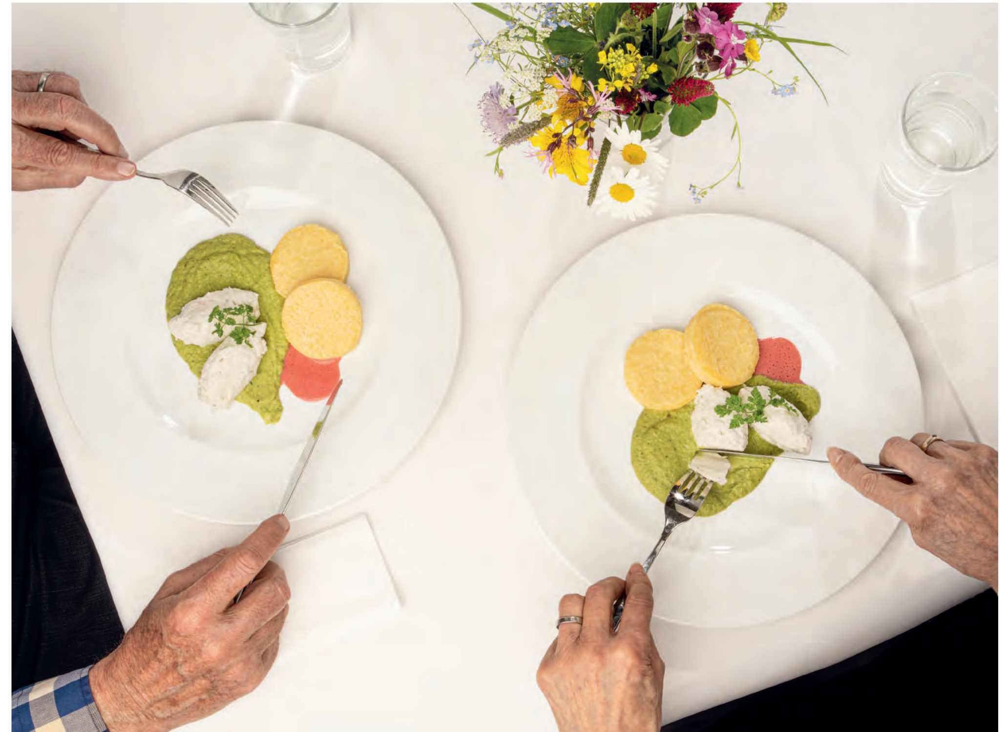
Gedämpfte 11er Polentini mit Zander-Nockerl auf Speck-Wirsing Püree und Rote Beete Kren Sauce. ■ Steamed 11er Polentini with pikeperch dumplings on a bacon-Savoy cabbage purée and a beetroot and horseradish sauce.