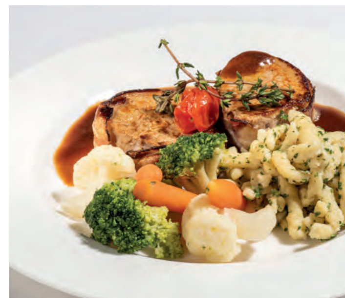
Links unten: 11er Röstikartoffeln, fein gerieben als „Rösti-Selchfleisch-Gröstl“ mit Spiegeleier und Schnittlauch | rechts unten: 11er Eierspätzle mit Kräutern dazu 11er Kaisergemüse Exclusiv, Schweinefilet im Speckmantel und Thymian-Jus. ■ bottom left: 11er Rosti Potatoes, grated potato as rosti-smoked meat gröstl with fried eggs and chives | bottom right: 11er Egg-Pasta Spaetzle with herbs served with 11er Emperor's Vegetables exclusive, pork tenderloin wrapped in bacon and thyme juice.