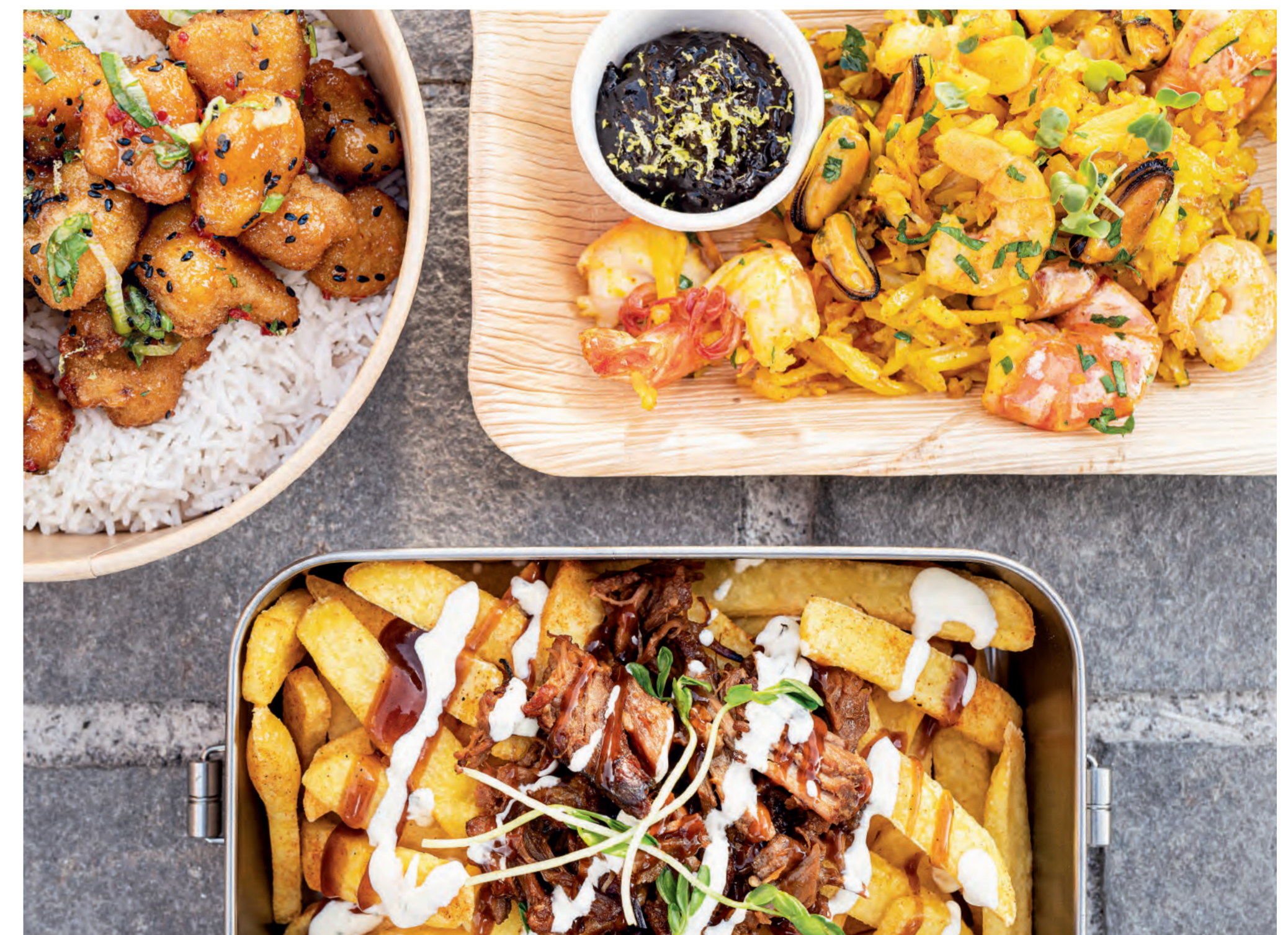
Links oben: Gebackene 11er Blumenkohlröschen, paniert in Sweet Chili Sauce mit frischem Koriander, Frühlingszwiebeln, schwarzem Sesam und Limettenabrieb auf Basmati-Reis | rechts oben: 11er Röst-Kartoffeln, fein gerieben als „Rösti Paella“ mit Safran und schwarzer Knoblauch-Limetten Mayonnaise | unten: 11er Pommes Rustikal mit Pulled Pork, BBQ Sauce, Sauercream und Kresse. ■ Top left: Baked 11er Breaded cauliflower in sweet chill sauce with fresh coriander, spring onions, black sesame seeds and lime zest on basmati rice | top right: 11er Rosti Potatoes, grated potatoes as rosti paella with saffron and black garlic-lime mayonnaise | bottom: 11er Country style Fries with pulled pork, BBQ sauce, sour cream and cress.