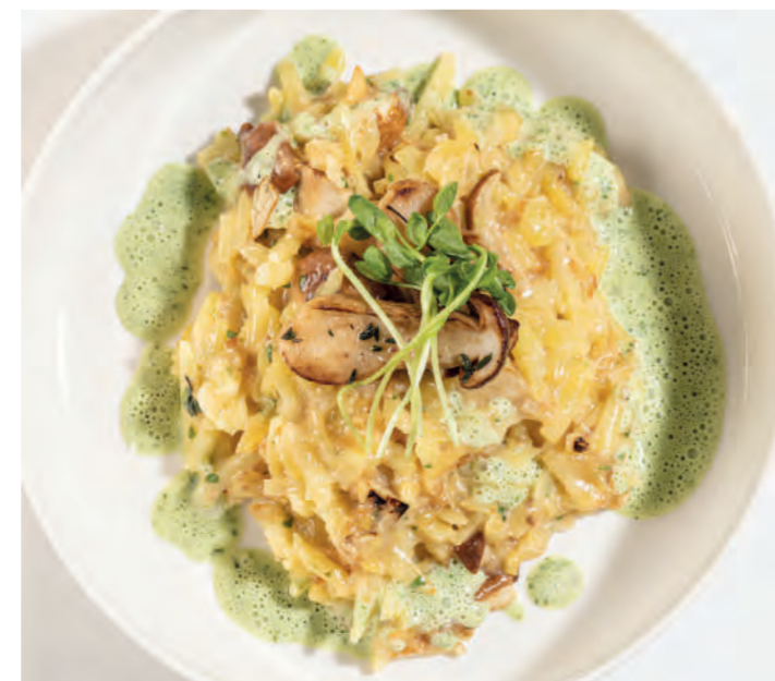
links: 11er Polentini mit geschmortem Kalbsbackerl auf Butter-Tomatensauce mit frittiertem Wurzelgemüse (11er Gemüse Julienne), Buchenpilzen und Kresse | rechts: 11er Rösti-Kartoffeln, fein gerieben als Steinpilz-Röstisotto auf Kräuter-Schaum. ■ 11er Polentini with braised veal cheeks on a butter and tomato sauce with deep-fried root vegetables (11er Vegetables Julienne), elm oyster mushrooms and cress | 11er Rosti Potatoes, grated potato as a cep-röstisotto on a herb mousse.