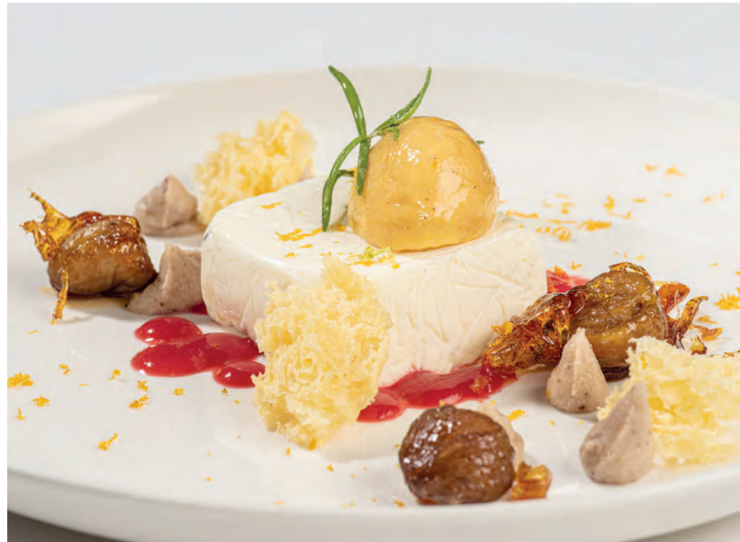
Orangeneis aus 11er Orangensaft Konzentrat auf Sauerrahm-Rosmarin-Mousse mit Orangen-Sponge, 11er Maronipüree, karamelierten 11er Maroni, Himbeersauce und Orangenzesten. ■ Orange ice-cream made from 11er Orange juice concentrate on a sour cream-rosemary mousse with orange sponge, 11er Chestnut Purée, caramelised 11er Chestnuts, raspberry sauce and orange zest.