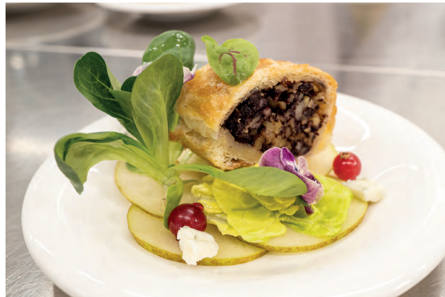
11er Röst-Kartoffeln, fein gerieben als Röst-Kartoffel-Blunzen-Strudel auf mit Walnuss-Dressing mariniertem Birnen-Carpaccio, Ziegenkäse, feine Blattsalate und Johannisbeeren. ■ 11er Rosti Potatoes, grated potato as rosti potato-black pudding strudel on a pear carpaccio marinated with walnut dressing, goat's cheese, fine lettuce leaves and currants.