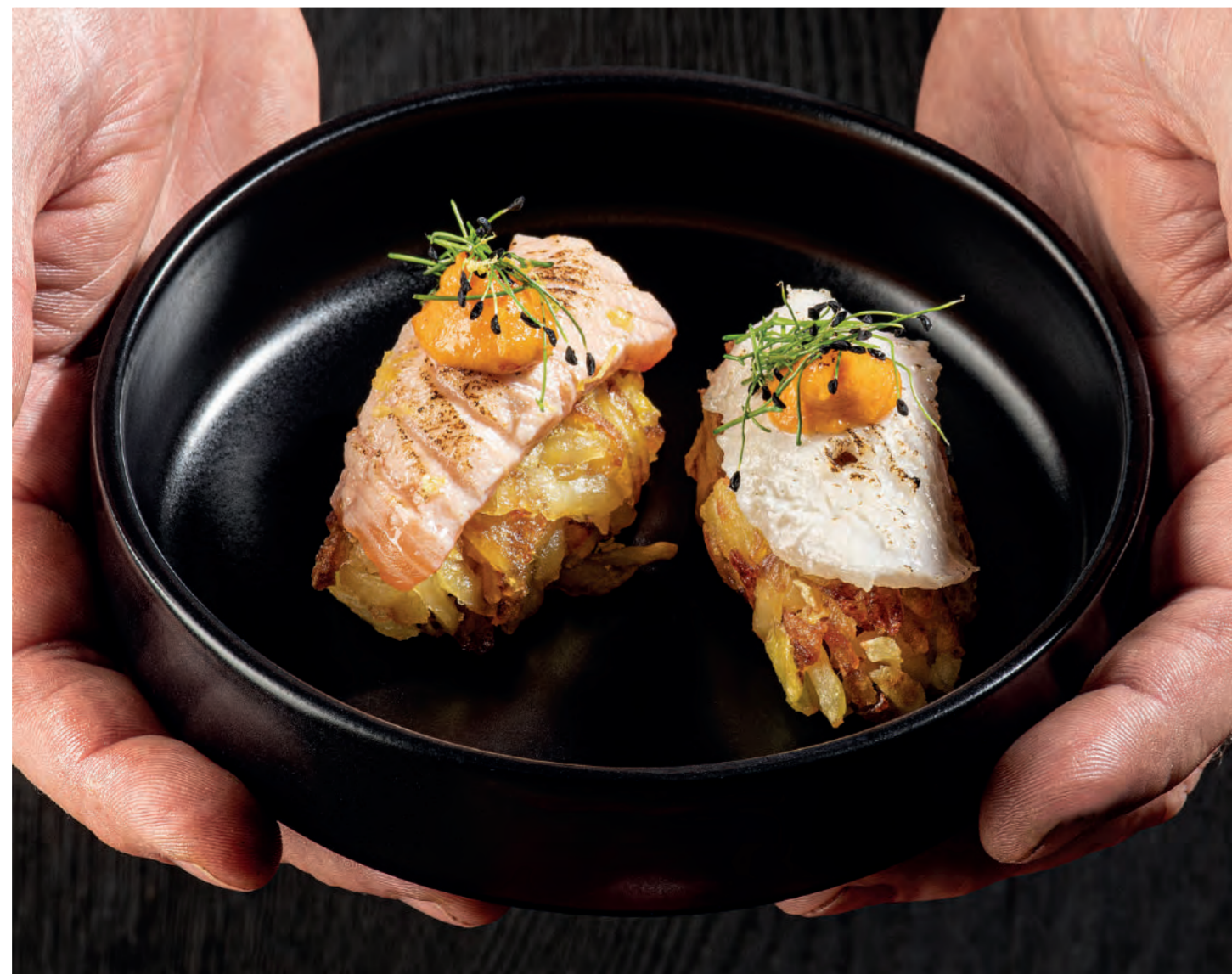
11er Rösti-Kartoffeln, fein gerieben als geflammtes „Alpensushi“ vom Lachs und Zander mit Chili-Ingwer-Cocktail Sauce und Schnitt-Knoblauch. ■ 11er Rosti Potatoes, grated potatoes as flambéed Alpine sushi from salmon and pikeperch with a chilli-ginger cocktail sauce and garlic chives.