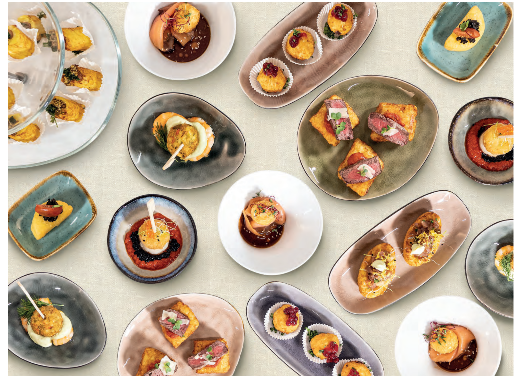
11er Rösti-Hot Dog mit grobem Dijon Senf und frittiertes Petersilie | 11er Rösti-Bergkäse Snack mit Preiselbeeren | 11er Gemüse-Kartoffel Snack auf gebratenen Garnelen, Avocado-Creme und Dill | 11er Rösti-Toasties mit Rindfilet-Streifen auf Tomatensauce und Grana Padana | 11er Mini-Schiffchen mit Tuna-Poke, Zitronenzesten und Wasabi-Mayonnaise. ■ 11er Rosti-Hot Dog with coarse Dijon mustard and deep-fried parsley | 11er Rosti-Cheese-Snack with cranberries | 11er Vegetable-Potato-Snack on fried shrimps, avocado cream and dill | 11er Rosti-Toasties with tenderloin strips on a tomato sauce and Grana Padana | 11er Mini Boats with tuna poke, lemon zest and wasabi mayonnaise.