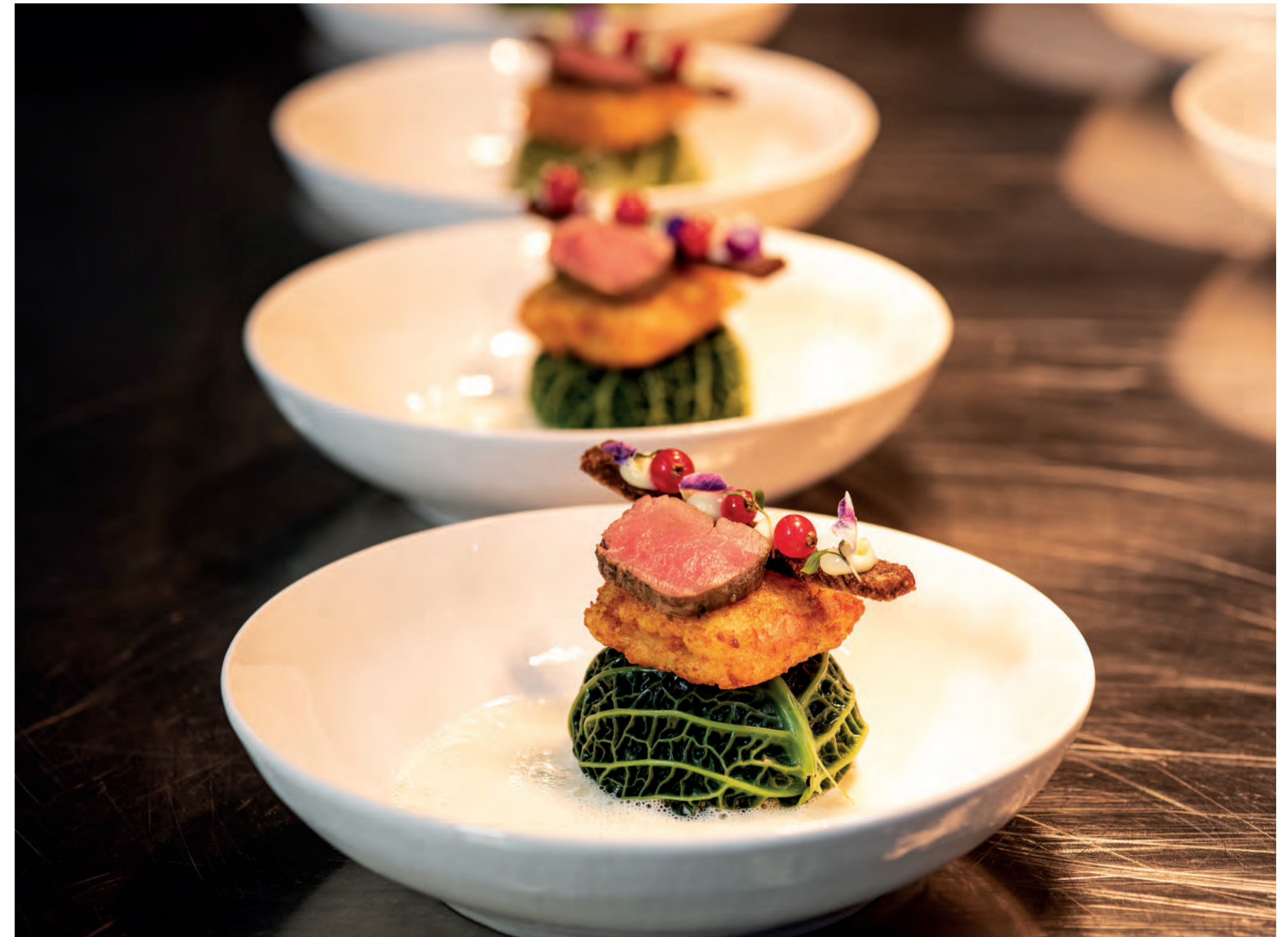
11er Rösti-Toasties gefüllt mit Schmelzkäse und Putenschinken auf einer Wirsing-Pfifferling Praline mit Rehfilet, geschäumter Riesling Veloute und Vollkorn-Cracker mit Knoblauch-Mayonnaise, Johannisbeeren und Blüten. ■ 11er Rosti-Toasties stuffed with cheese spread and turkey ham on a Savoy cabbage-chantarelle praline with fillet of venison, frothed Riesling veloute and wholemeal crackers with garlic mayonnaise, currants and edible blooms.