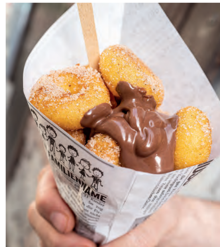
Rechts: 11er Mini-Donuts in Zimt-Zucker mit Nougat-Creme | links: 11er Speck-Rösti, wie hausgemacht als „Speckrösti-Wild-Burger“ mit Camembert, Rotwein-Zwiebeln, Bärlauch Pesto, Steinpilz-Duxelles, Aioli und Rucola. ■ Right: 11er Mini Potato Donuts in cinnamon sugar with nougat cream | left: 11er Rosti with bacon, homemade style as bacon-rosti-venison burger with Camembert, onions in red wine, wild garlic pesto, cep Duxelles, aioli and rocket.