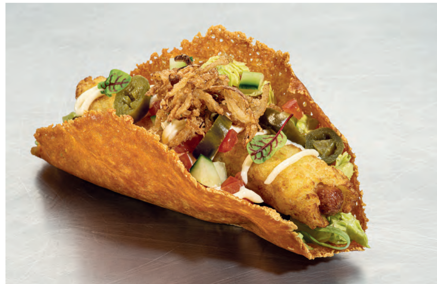
11er Röst-Hot Dog (Putenwürstchen im Röstmantel) im Käse Taco auf Römersalat, Jalapeno-Scheiben, frischen Tomaten und Gurkenwürfel, Tomatensalsa, Aioli, Röstzwiebeln und Baby-Leafs. ■ 11er Rosti-Hot Dog (turkey sausages in a rosti coating) in a cheese taco on romaine lettuce, sliced jalapeno, fresh tomatoes and diced cucumber, tomato salsa, aioli, fried onions and baby leafs.