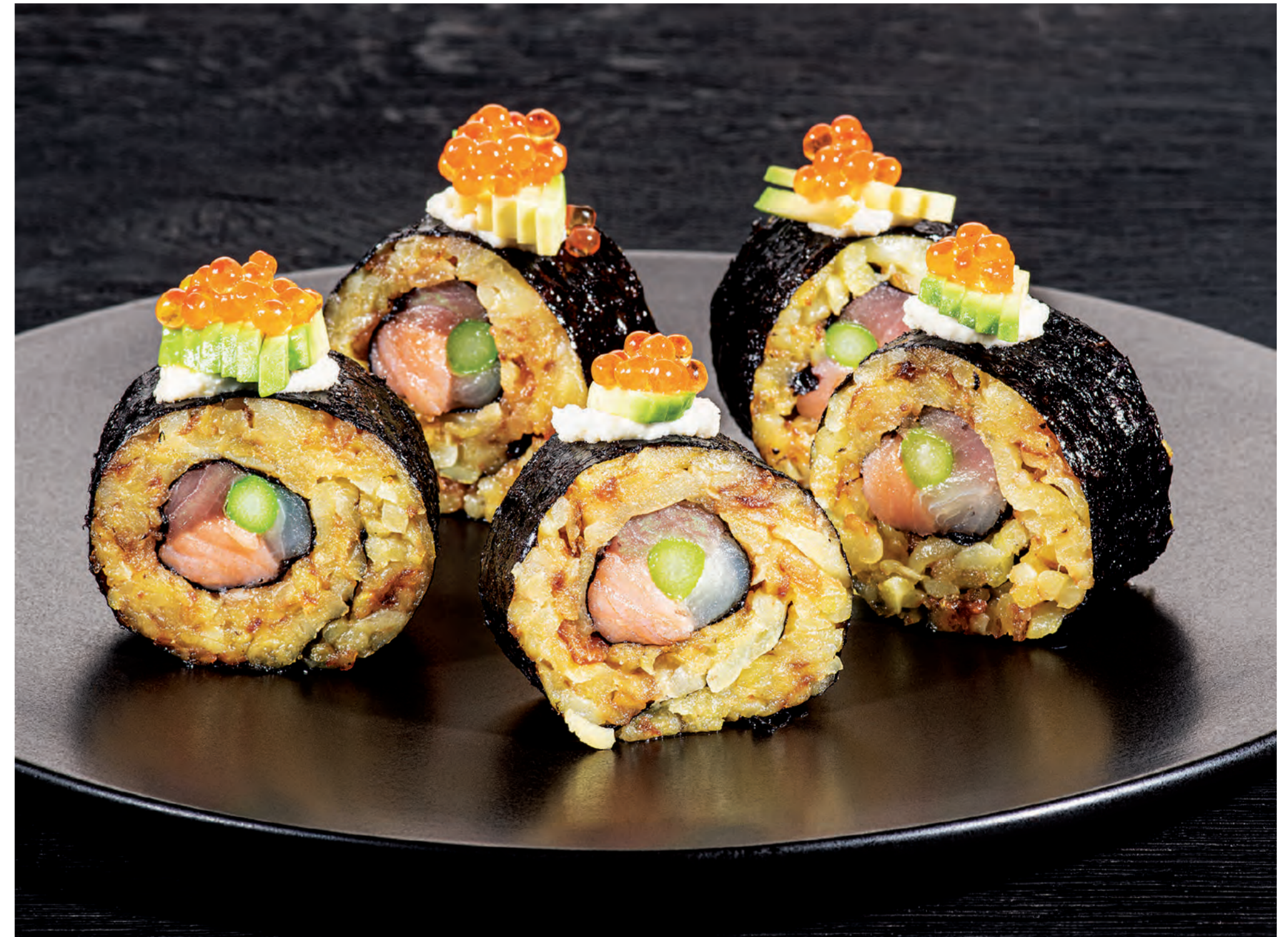
11er Rösti-Kartoffeln, fein gerieben als „Rösti Maki“ mit Thunfisch, Lachs, weißem Thunfisch und Spargel, dazu Meerrettich-Creme, Avocadoscheibchen und Forellen-Kaviar. ■ 11er Rosti Potatoes, grated potatoes as rosti maki with tuna, salmon, white tuna and asparagus, served with horseradish cream, sliced avocado and trout caviar.

Chefs let their guests look over their professional shoulder whilst cooking and explain the stories behind their dishes. They rely on emotions and intense aromatic impressions to address all of the senses. The kitchen is pushed to the "front" so that eating becomes an exclusive experience for guests. Exceptional 11er rosti specialities leave plenty of room for creativity and ensure that tastes will linger for long after the meal. Live cooking stands for unadulterated freshness in plain view of the guests, prepared à la minute, perfect for small, intimate kitchen parties.