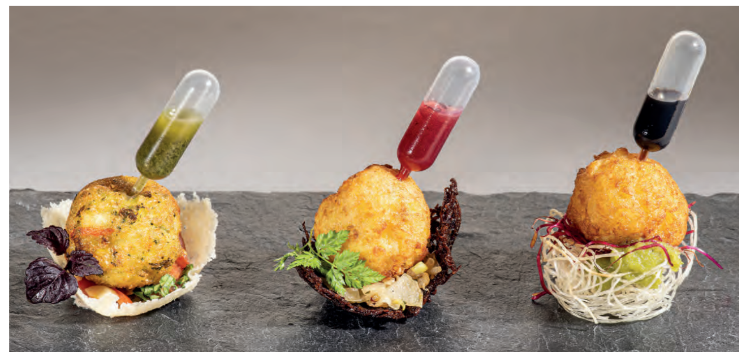
von links nach rechts: 11er Gemüse-Kartoffel-Snack im Parmesankörbchen, Bruschetta-Tomaten, Basilikum Rosso und Basilikum-Pesto-Pipette | 11er Röst-Bergkäse Snack im Trüffel-Kartoffel-Körbchen mit geschmorten Kümmel-Zwiebeln, Kerbel und Preiselbeer-Pipette | 11er Röst-Lachs Snack im Glasnudel-Körbchen auf Wasabi-Ingwer-Mayonnaise, Rote Beete Sprossen und Sojasauce-Pipette. ■ Left to right: 11er Vegetable-Potato-Snack in parmesan baskets, bruschetta tomatoes, red rubin basil and a basil-pesto pipette | 11er Rosti-Cheese-Snack in truffle-potato baskets with braised onions in caraway seeds, chervils and a cranberry pipette | 11er Rosti-Salmon-Snack in a glass noodles basket on wasabi-ginger mayonnaise, beetroot sprouts and a soy sauce pipette.