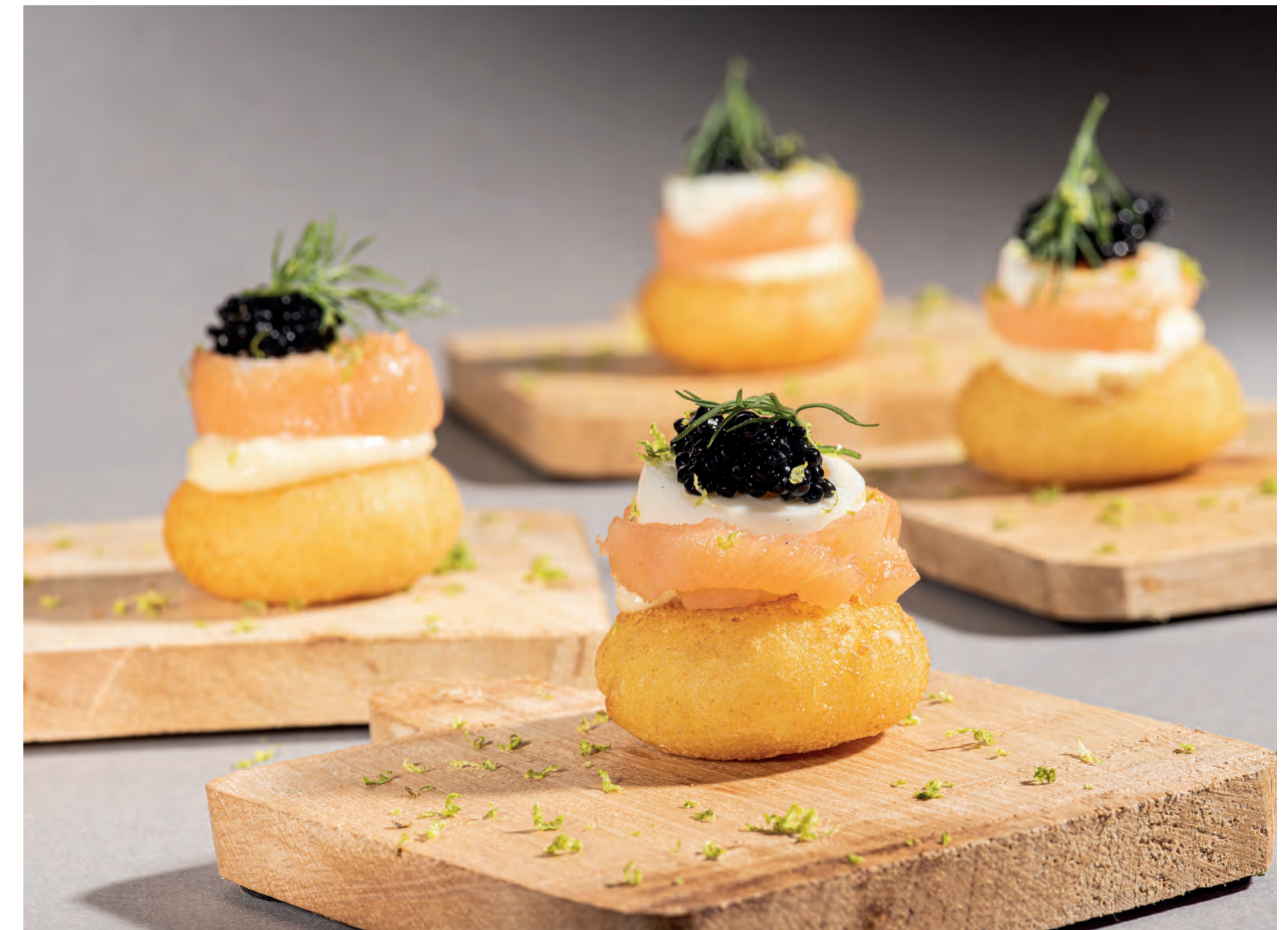
11er Mini-Donuts mit Aioli, wachswiechem Wachtelei, Räucherlachs, Kaviar, Limetten-Zesten und Dill. ■ 11er Mini Potato Donuts with aioli, soft quail's eggs, smoked salmon, caviar, lime zest and dill.