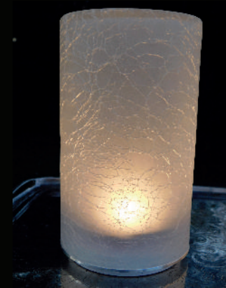
Vintage Tower PLS-TL-06