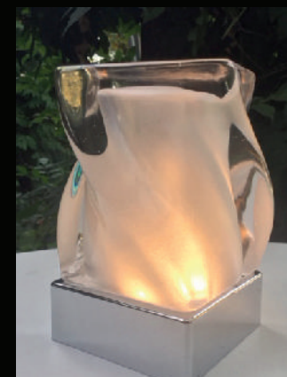
Quarz Wave PLS-TL-07