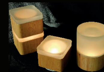
Woody Serie PLS-TL-18

Hochwertige Oberflächen, ansprechende und werthaltige Haptik, spannende Formen und natürlich hochwertiges Licht erstellen auf Ihren Tischen ein nachhaltiges Wohlfühlklima und eine ansprechende Optik. Ihre liebevoll zubereiteten und präsentierten Gerichte bekommen so auch bei wenig Umgebungslicht zur dementsprechenden Geltung. Nach den Gängen kann die Tischbeleuchtung von „funktional“ auf gemütlich bis hin zu romantisch runtergedimmt, oder jede beliebige Farbe gewählt werden.