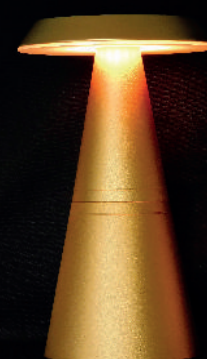
Highend Line Excelsior PLS-TL-21