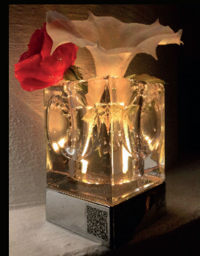
Kristall Star Vase PLS-TL-09