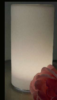
Satin Tower PLS-TL-04