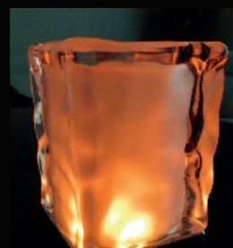
Quarz Vision PLS-TL-08