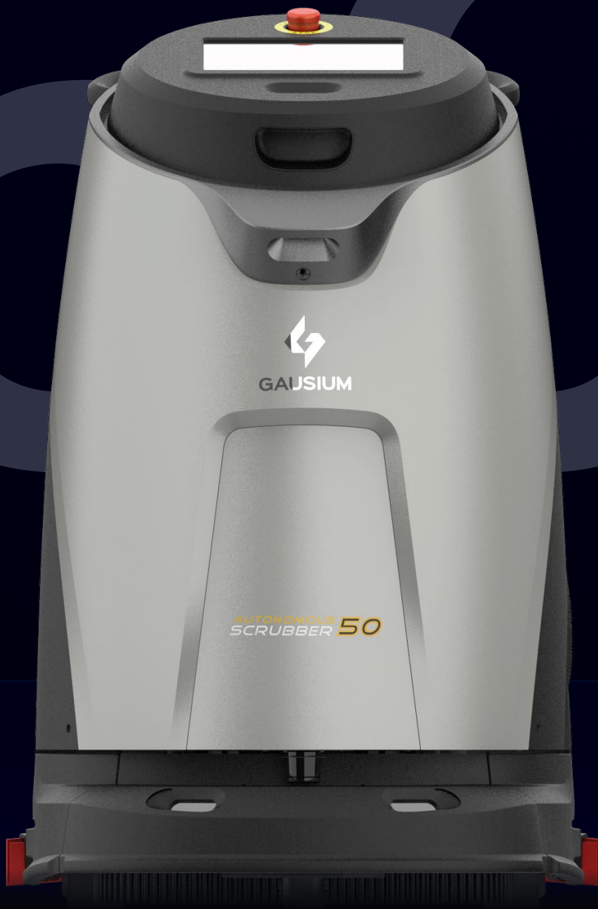
Schrubber 50 Pro KI-gesteuerter Bodenreinigungsroboter