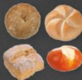
Jour Gebäck Mix 1,20 €