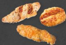
Jour Snack Gebäck 2,70 €