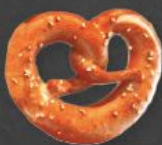
Jour Breze 1,20 €