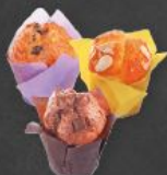
Mini Muffin Mix 1,70 €